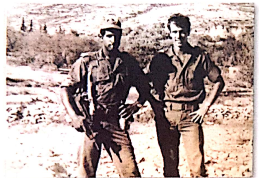
ישראל (משמאל) בעת סיור שגרתי בבקעה