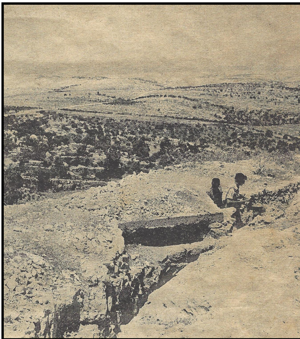
ממש קו מאז'ינו: תעלות מגן עמוקות, ועמדות ירי בעלות גגות-בטון יצוק בבית חורון עליון

זה היה הקרב הקשה ביותר. מרגמות, תול"רים ואש מקלעים ניסו לשתק את עמדות הירי של הלגיון – בשעה שטנק וחבלנים טרחו לסלק את המכשול מעל הכביש. היו גילויי גבורה נהדרים, היו נפגעים – אבל המחסום פוצח לבסוף, וברגע שגלגלינו התחילו לטפס על מעבר למחסום – התחילה הבריחה מכל העמדות.