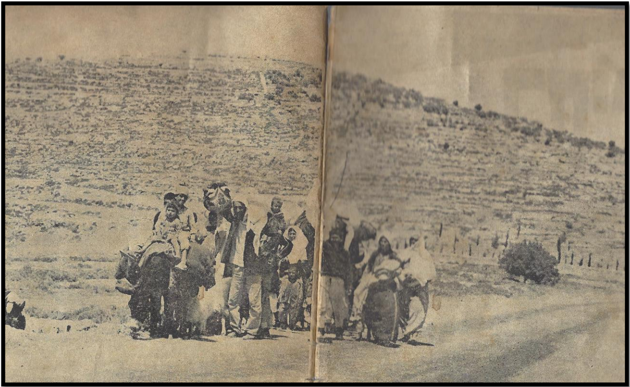
דגל לבן באוויר, צורות על הכתפיים – והם חוזרים לבתיהם

ונתגלגלה השיחה להמשך המחשבות והמסקנות, עם הנוף, עם המראות המצטרפים אחד לאחד. הם חוזרים הפליטים, חוזרים לבתיהם ולעבודתם. באיזו מהירות הסתגלו למצב החדש! במידה שהייתה מלחמה – נלחם הצבא. העם לא נקף אצבע. היו שנמלטו על התחלת הרעש, אבל אלה שנשארו והסתגרו בבתיהם – הניפו את סמרטוטיהם הלבנים על הגגות והחלונות, ברגע שחשו במנוסת צבאם. כן, מנוסת הצבא.....הנה חולפים אנו מעל לבקעה נאה, בה שורה של מחפורות מסודרות. מסביר צימל: